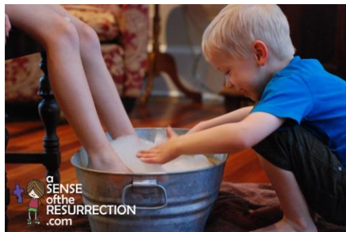
Ebook A Sense of the resurrection

“Eu lhes dei o exemplo, para que vocês façam como lhes fiz.”