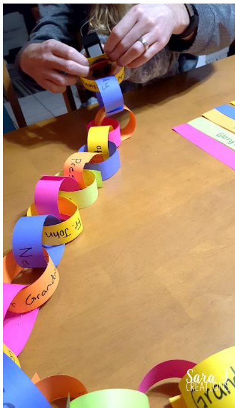
Sara J Creations

Ensino: Com quem você conversa quando está triste? A quem você conta os seus medos e pede ajuda quando não consegue fazer algo que considera difícil? (deixe que a criança se expresse e conte a ela a quem você recorre nessas mesmas situações, geralmente a um amigo ou familiar).