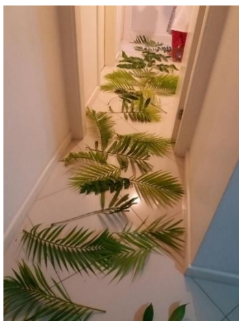
Nossa encenação de 2017

Sugestão de visual: App da Bíblia – Um jumento e o Rei