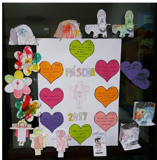
Nosso painel de Semana Santa de 2017

Esse ano me inspirei na sugestão do site We little miracles que, inclusive, disponibiliza os arquivos para impressão das ilustrações da guirlanda de graça.